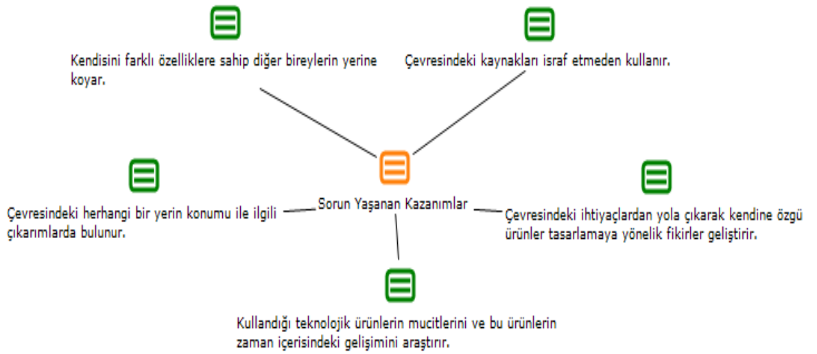
Şekil 1. Sosyal bilgiler öğretim programında sorun yaşanan kazanımlar

Araştırmada elde edilen bulgular ışığında sınıf öğretmenlerinin sorun yaşadığı kazanımlar Şekil 1’de gösterilmiştir.