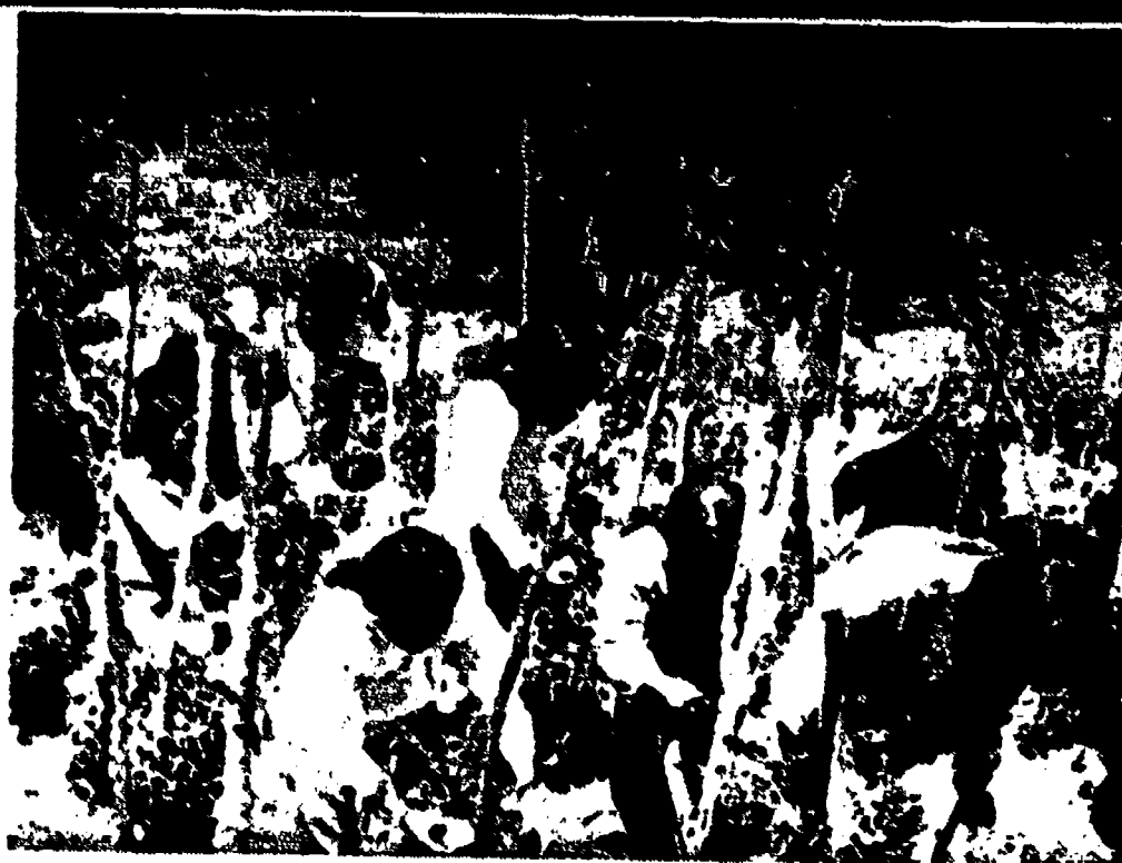
Proyecto de hortalizas: Grupo de alumnas hacen la recolección en un proyecto de tomate. Más tarde el producto es usado como material de enseñanza en la especialidad vocacional de "Economía del Hogar".