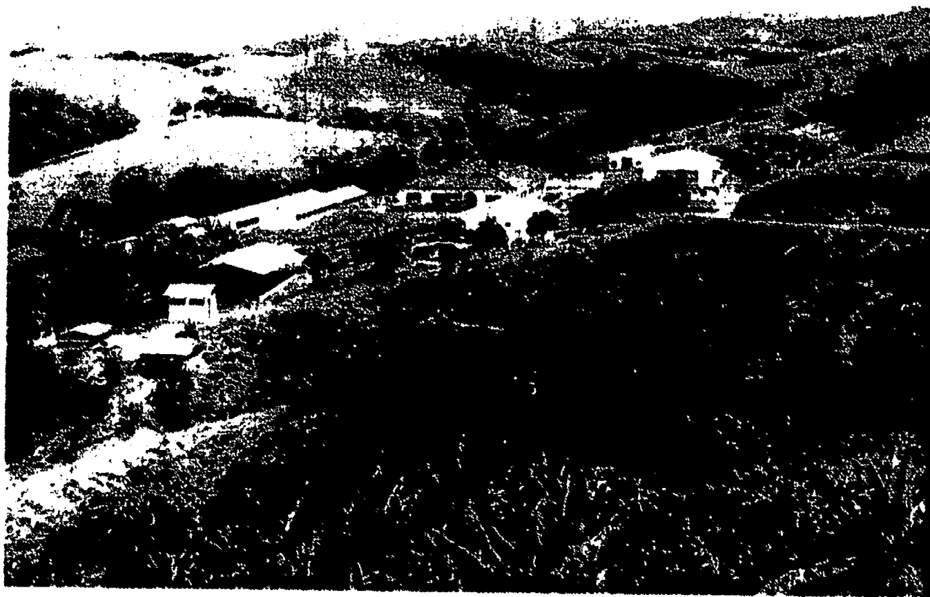
Parte de las instalaciones de una concentracion rural agricola.