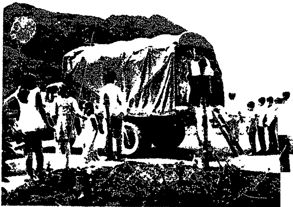
La labor educativa en el área rural solo es efectiva cuando se cuenta además con algunos servicios básicos de bienestar educativo, tales como el restaurante y el transporte escolar.

Las actividades escolares se proyectan hacia las comunidades. Un grupo de alumnas saca modelos de algunas manualidades, que unos días después servirán de muestras para las manualidades en los hogares y en los clubes de "Amas de Casa".