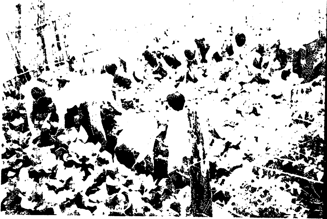
Un grupo de alumnos asociado al Club 4.5, desarrollan prácticas agrícolas supervisadas, en forma cooperativa, en el proyecto de un socio.