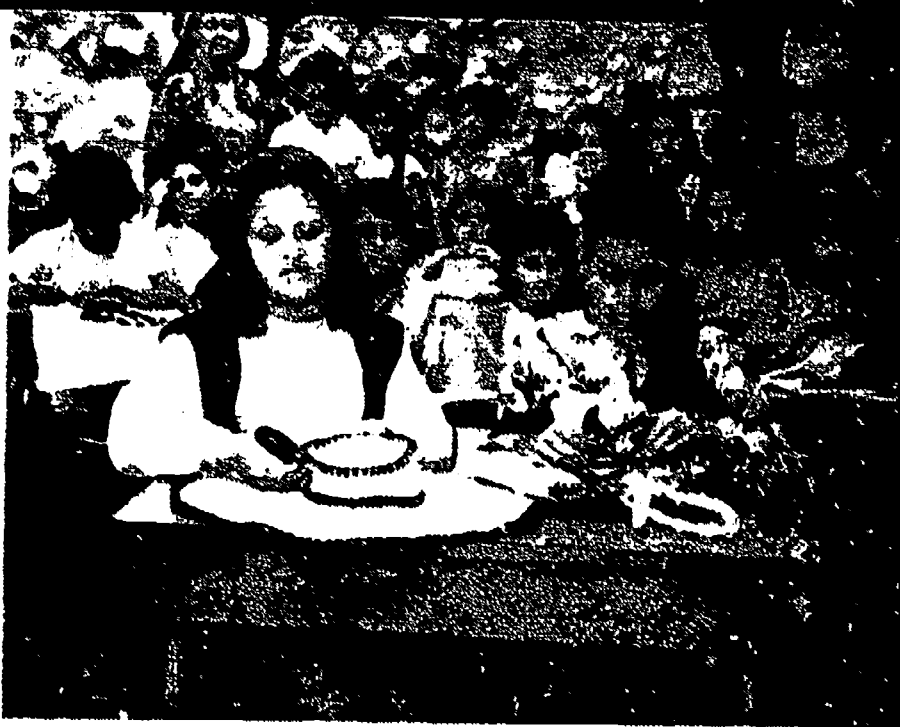
La capacitación de la mujer en algunas manualidades contribuye al mejoramiento de la economía y al mejoramiento del hogar.