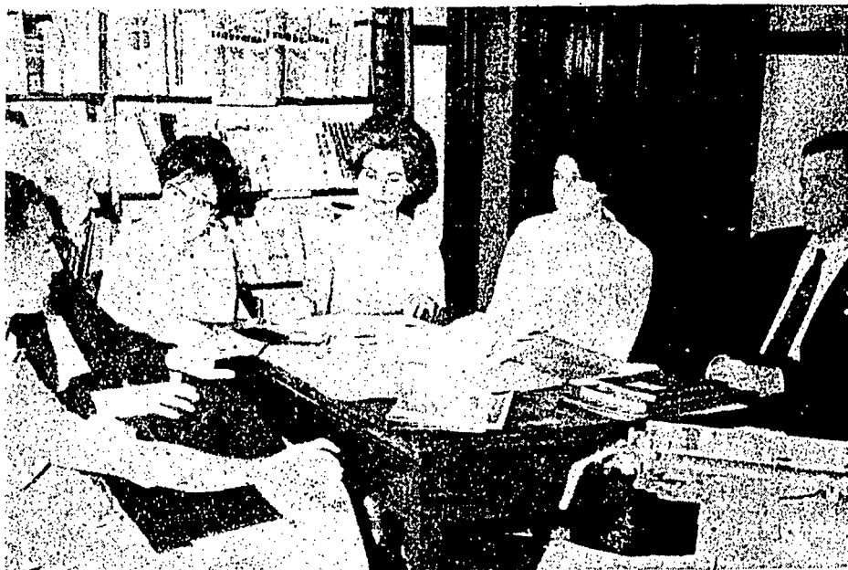
Integrantes de la Sub-Comisión de Educación